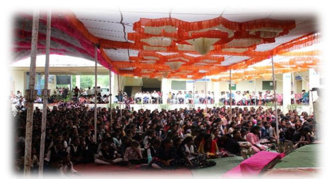
Page 8 of 11